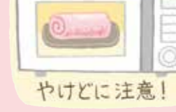
イラストレーション：浦本典子