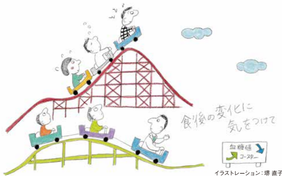
イラストレーション：堺直子

11月14日は世界糖尿病デーです。これを機に、糖尿病予防のために生活習慣を振り返ってみましょう。なお、血糖値スパイクについてわからないことがあるときは、薬局の薬剤師に気軽にご相談ください。